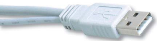
Y-Kabel: USB 3.0 benötigt solche zweigeteilten Kabel nicht mehr. USB 3.0 versorgt Geräte standardmäßig mit 900 mA (Bild A)

Die Spezifikation sieht vor, dass USB-A-Buchsen und -Stecker mit einem blauen Inlay versehen sind (Bild B). Da fast alle USB-Anschlüsse bisher ein schwarzes oder weißes Inlay aufwiesen, reicht dies als Unterscheidungsmerkmal aus.