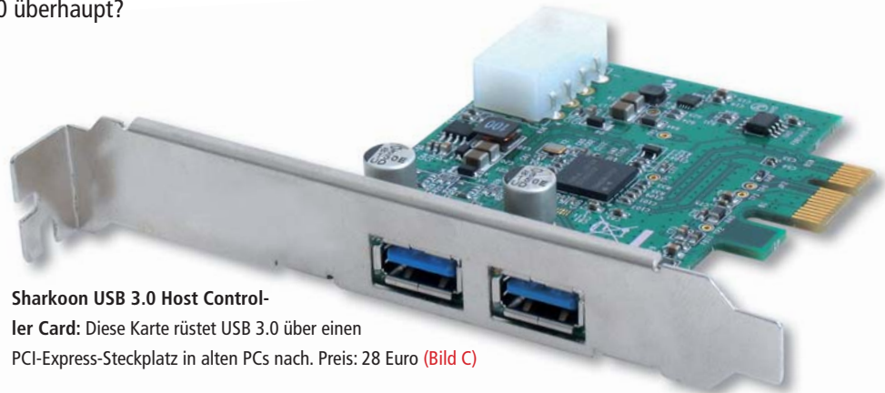
Sharkoon USB 3.0 Host Control-

Während USB 2.0 nur eine theoretische Maximalgeschwindigkeit von 480 MBit/s erreicht, schafft USB 3.0 mit dem Übertragungsmodus Super-Speed theoretisch bis zu 5120 MBit/s. Das entspricht maximal 640 MByte/s. In der Praxis liegt die Datenrate aber auf-